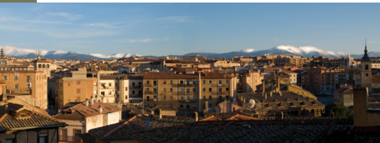
Mirador de la Canaleja. En la Calle Real, por donde caminaba Antonio Machado para ir desde su pensión hasta el instituto donde impartía clase.